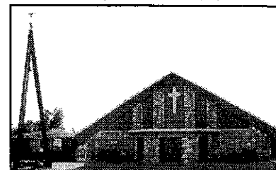
Saint-Rédempteur 421, boul. Labelle Blainville (Qc) J7C 2H4 Télécopieur: 450 435-5741

Courriel : info@paroissessaintefamille.com • www.paroissessaintefamille.com